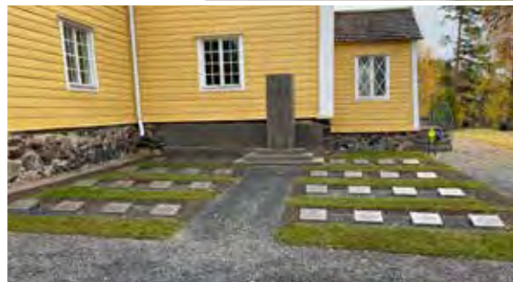
Under hösten 2022 har gravområdet byggts om för att göra uppvaktningarna vid hjältegravens lättare.