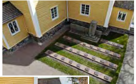
Hjältegravens fotografierad 2020.

Föreningen upplöstes 1973 och egendomen överläts till Snappertuna församling. Fonden finns sedan dess kvar i samfällighetens bokföring och fondens kondoleanser finns fortfarande till försäljning. (YL)