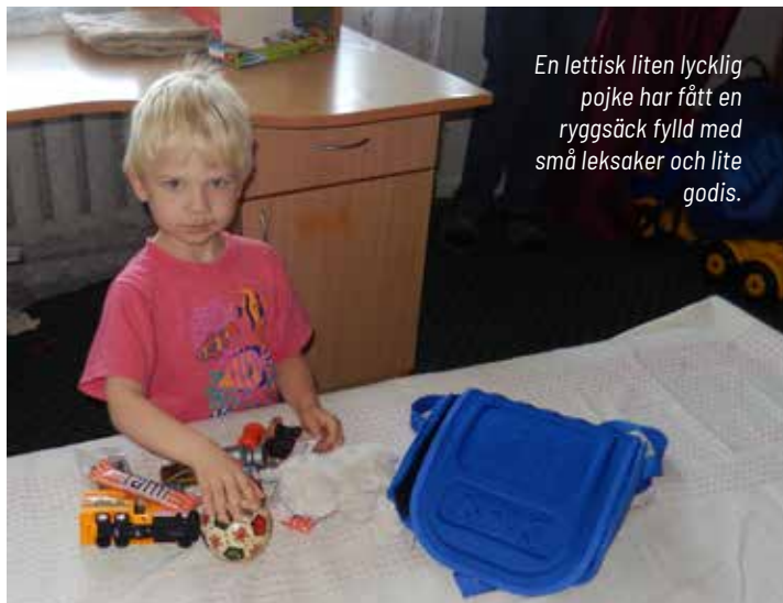
En lettisk liten lycklig pojke har fått en ryggsäck fylld med små leksaker och lite godis.

Det har nu gått ca tio år sedan Fynda startade. Vi är många som bidragit med vårt jobb för den verksamheten. Det har varit givande och roligt på många sätt. Att kunna bistå med förnödenheter av olika slag där det verkligen behövs känns meningsfullt.