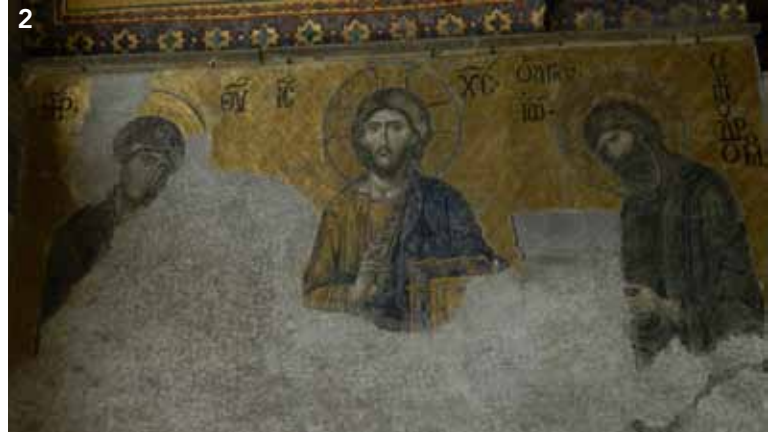
1. Chora, närbild av mosaik. 2. Desis – ikonen i Hagia Sofia. 3. Det ekumeniska patriarkatet i Istanbul. 4. Vy från stan. 5. Det blå ögat, som skyddar och vänder bort de onda blickarna.