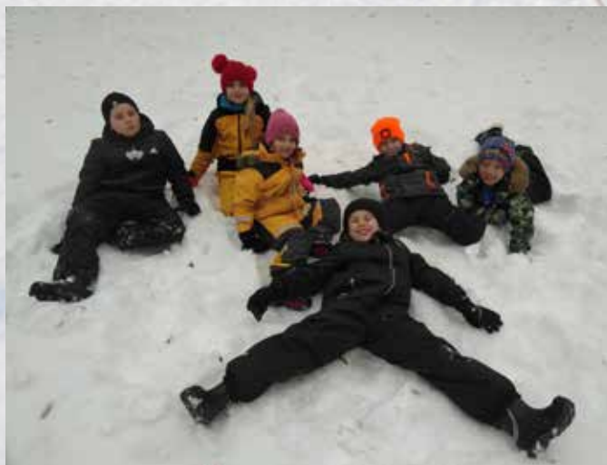
Några av eftisbarnen ute i snön på gården.