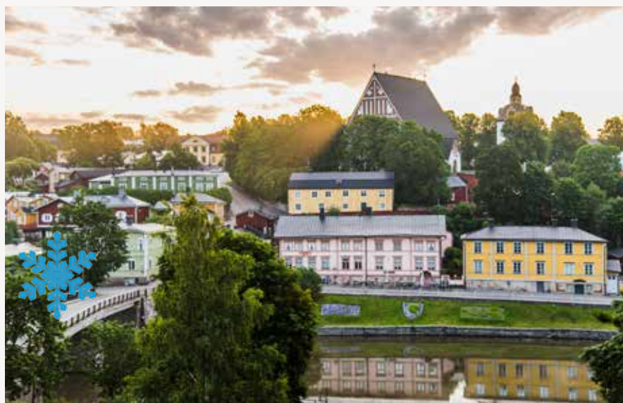
Borgå domkyrka

Jubileumsåret inleddes med nyårshögmässa i Borgå domkyrka och nyårsmottagning i biskopsgården och det avslutas med Stiftsdagar och jubileumsfest den 27-29.10 på Konstfabriken i Borgå.