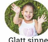
Glatt sinne i naturen