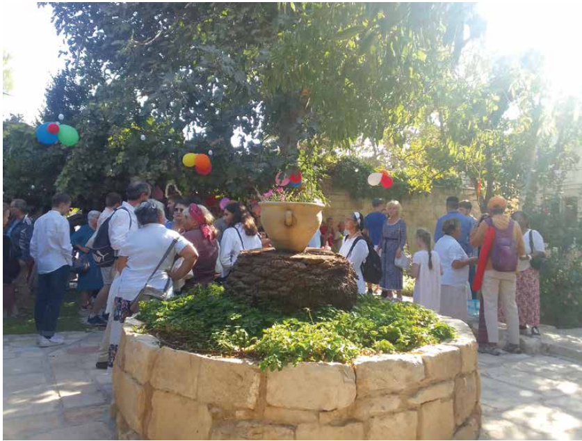
Kyrkkaffe i messianska församlingen.

Utan tolkning förstår jag en bråkdel av vad som sägs. I gudstjänsten kan jag knäppa på engelskan men det funkar inte överallt. Insikten gör mig ödmjuk och mottaglig för den Helige Andes tilltal, jag lyssnar mera i anden än med mina fysiska öron. Jag imponeras också av de otaliga immigranter, i första hand judar från olika håll i världen, som valt eller tvingats lämna allt för att börja ett nytt liv i en obekant språkmiljö och främmande kultur.